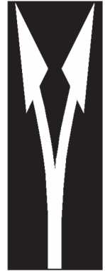
NSR : Marq-7