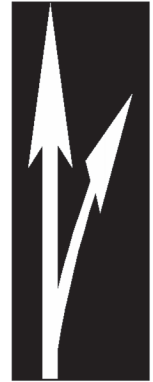
NSR : Marq-8