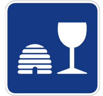
Boisson à base de miel hydromel

Pictogramme centré et dimensionné de façon à optimiser l'espace disponible tout en respectant les marges et proportions des images montrées au Tome V ( chap. 5, Annexe A)