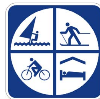
Centre de vacances

Les symboles sont à titre d'exemple. Ils peuvent varier selon les activités admissibles.