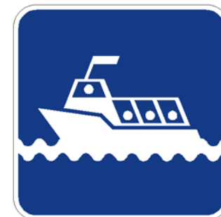
Croisière et excursion nautique

Pictogramme centré et dimensionné de façon à optimiser l'espace disponible tout en respectant les marges et proportions des images montrées au Tome V ( chap. 5, Annexe A)