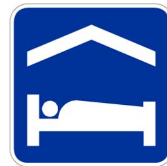
Établissement hôtelier et résidence de tourisme

Pictogramme centré et dimensionné de façon à optimiser l'espace disponible tout en respectant les marges et proportions des images montrées au Tome V ( chap. 5, Annexe A)