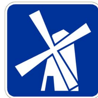
Moulin à vent

Pictogramme centré et dimensionné de façon à optimiser l'espace disponible tout en respectant les marges et proportions des images montrées au Tome V ( chap. 5, Annexe A)