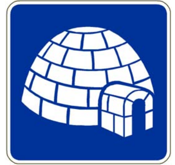
Hébergement en igloo

Pictogramme centré et dimensionné de façon à optimiser l'espace disponible tout en respectant les marges et proportions des images montrées au Tome V ( chap. 5, Annexe A)